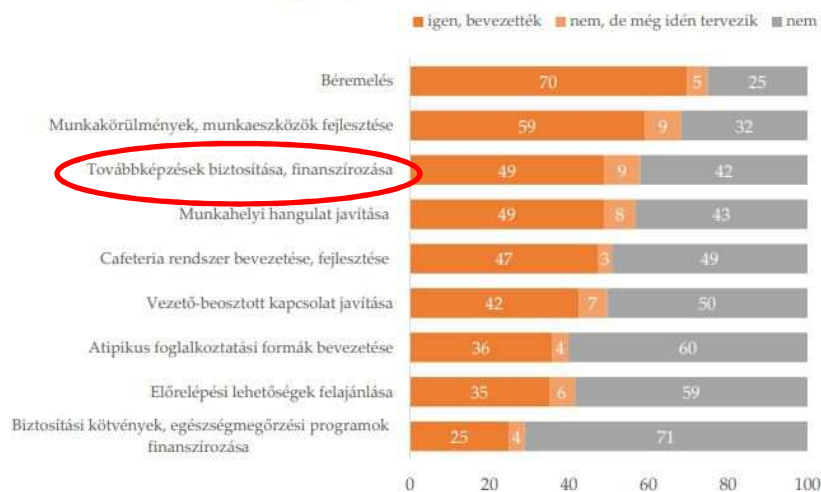
A vállalkozások meglévő munkaerejük megtartása érdekében megtett, illetve tervezett lépései, N=400 (százalék)

A vállalkozások döntő többsége tett lépéseket annak érdekében, hogy megtartsa meglévő munkaerejét.